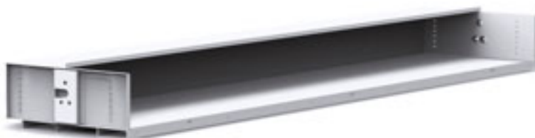
Otevřená patra pro různé způsoby uložení zboží.