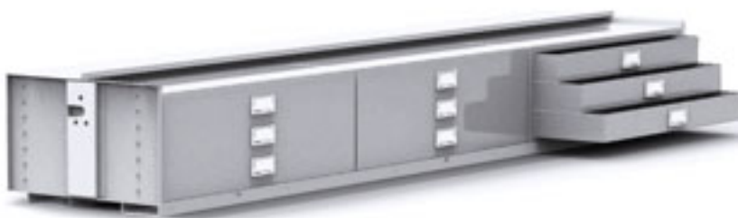
Otevřená patra s integrovanými zásuvkami pro bezpečné a přehledné skladování.