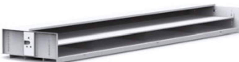
Patra s mezipolicí pro uskladnění dlouhého a nízkého zboží.