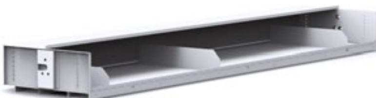
Patra s dělítky pro snadné rozdělení skladovaného zboží.